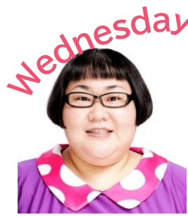
安藤なつ (メイプル超合金)