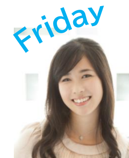
東島衣里 (ニッポン放送アナウンサー)